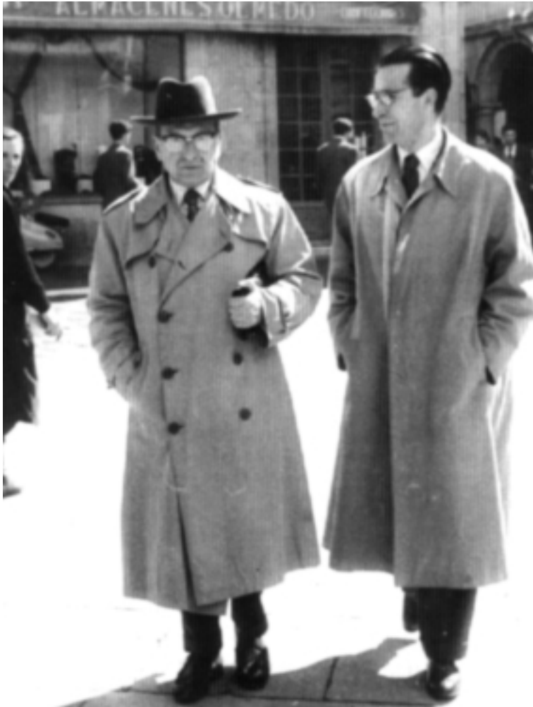
Carballo Calero, á esquerda, con Ramón Piñeiro (Santiago de Compostela, 1957)