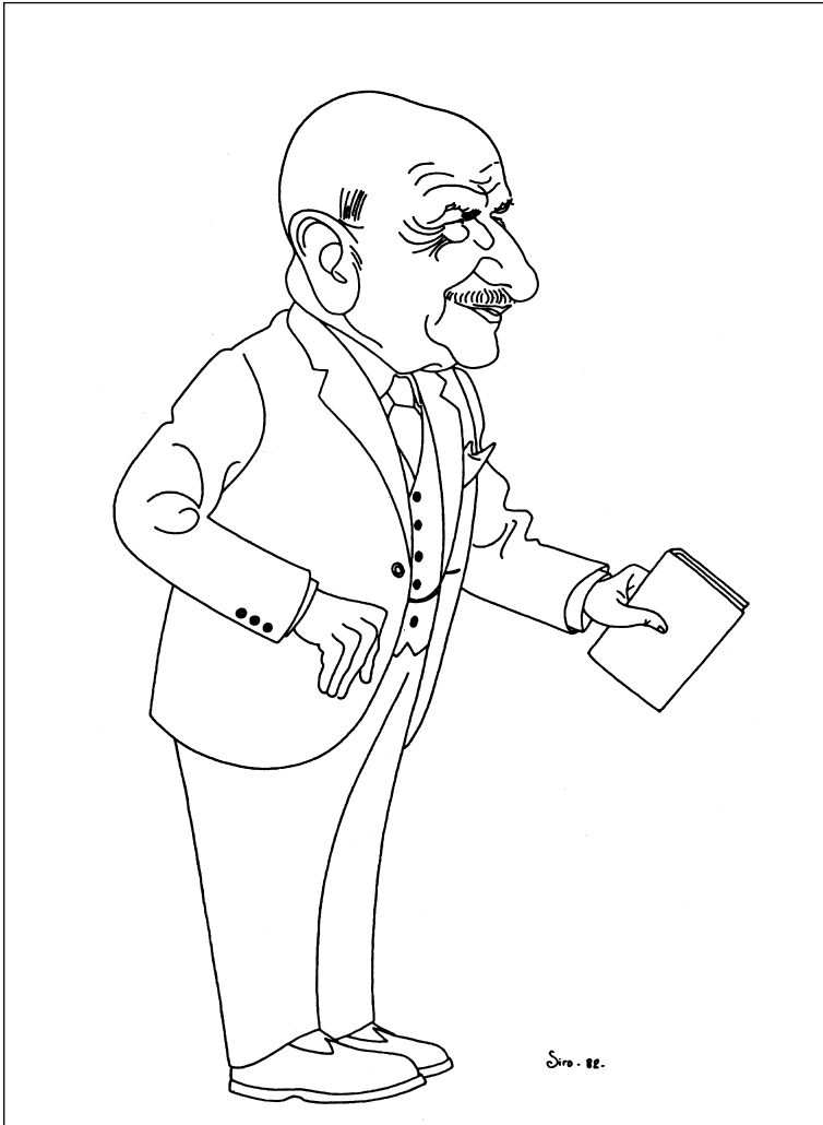
Carballo Calero visto por Siro