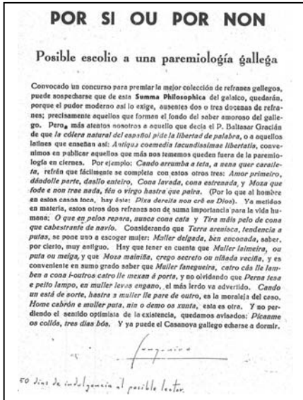
[Nota manuscrita do orixinal] Cunqueiro 50 días de indulgencia al posible lector